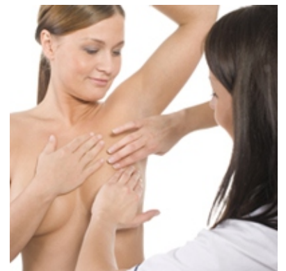
Examen Clínico de los Senos