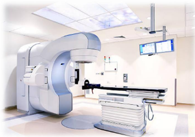
Vista de: Acelerador Lineal Maquinaria que administra la Radioterapia Externa

El Hospital HIMA•San Pablo Oncológico, cuenta con servicios especializados para el cuidado de pacientes con cáncer. En nuestras facilidades localizadas en Caguas, contamos con áreas para realizar diagnóstico, estudios especializados, tratamientos de quimioterapia y radioterapia y hospitalización, entre otros.